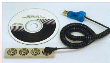
パソコン用ボタン型クールメモリーリーダー